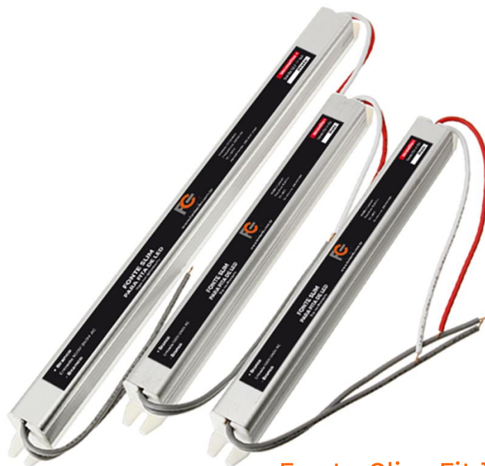
Fonte Slim Fit 12V 6A