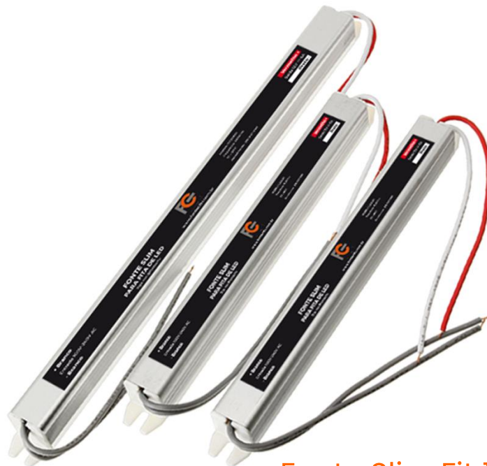
Fonte Slim Fit 12V 5A