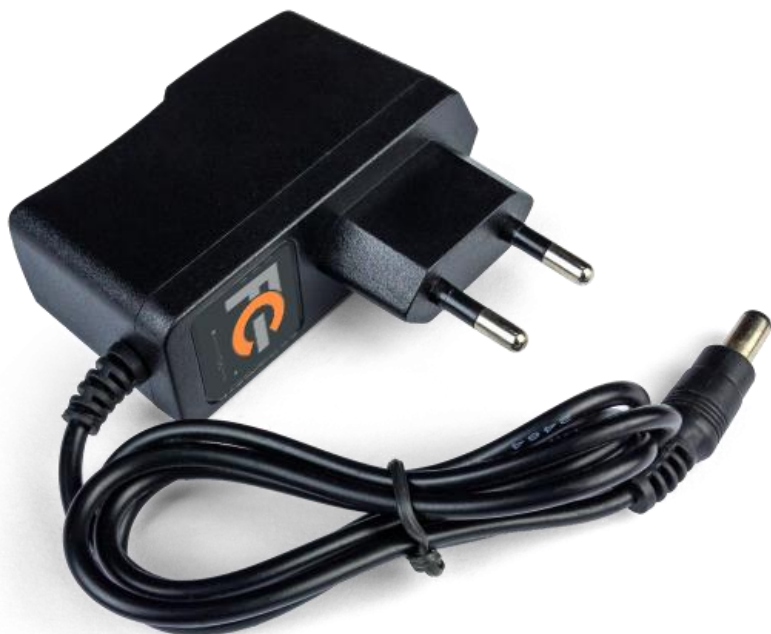
Fonte Eletrônica 12V 0,5A