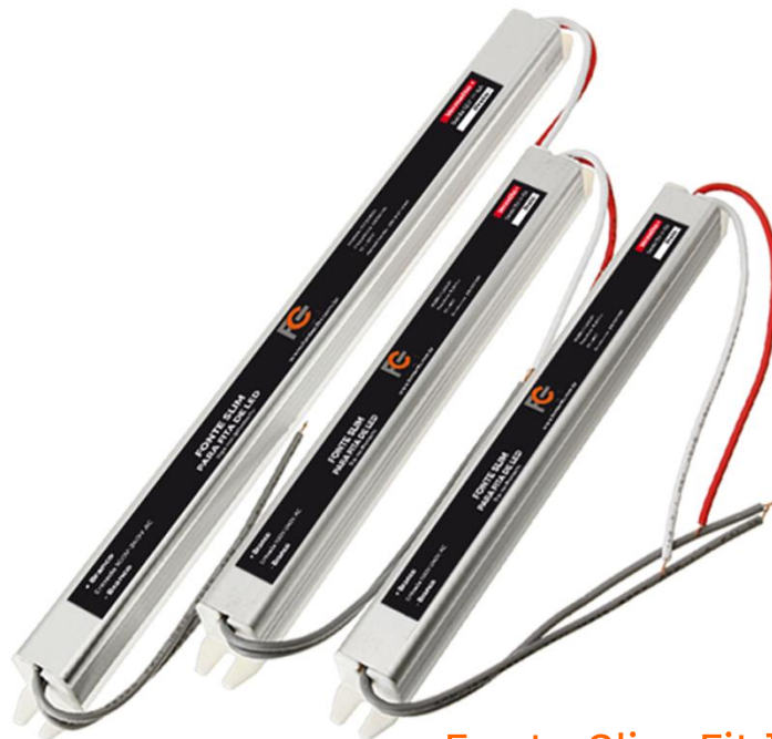
Fonte Slim Fit 12V 3A