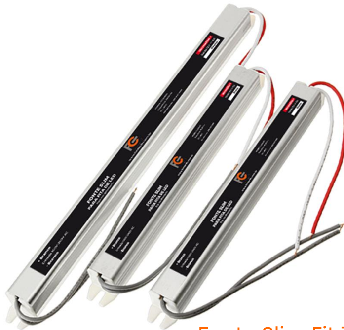
Fonte Slim Fit 12V 2A