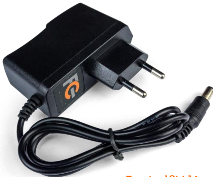
Fonte 12V 1A